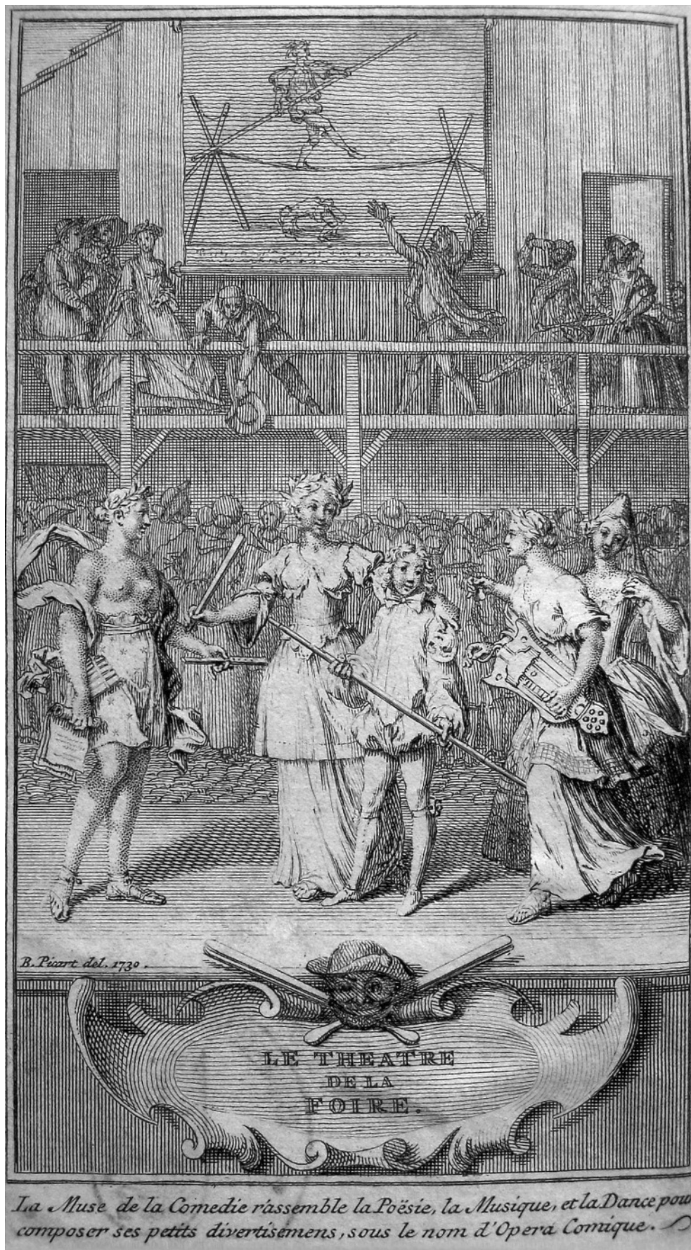
Abb. 3: LE SAGE: Théâtre de la Foire , Bd. 6 (1731). Allegorie der Künste des »Théâtre de la Foire«